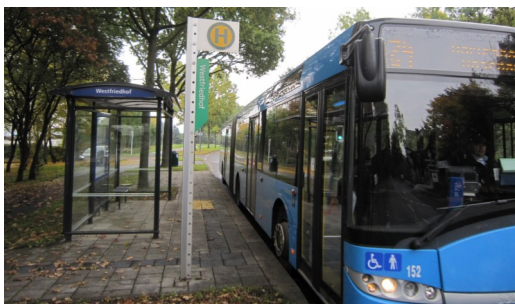
Die Buslinie 24 an der Haltestelle Westfriedhof

Zudem sei festzustellen, dass viele Schülerinnen und Schüler lieber Straßenbahn fahren, so die Aussage der KVG. Des Weiteren weist die KVG auf die geplanten Verbesserungen der Straßenbahnanbindung für unseren Stadtteil hin. Dass dies allerdings für die Bewohnerinnen und Bewohner der Dönchesiedlung, des Holzgartens und der Besucherinnen und Besucher des Westfriedhofes nur geringe oder keine Bedeutung hat, ist ver-