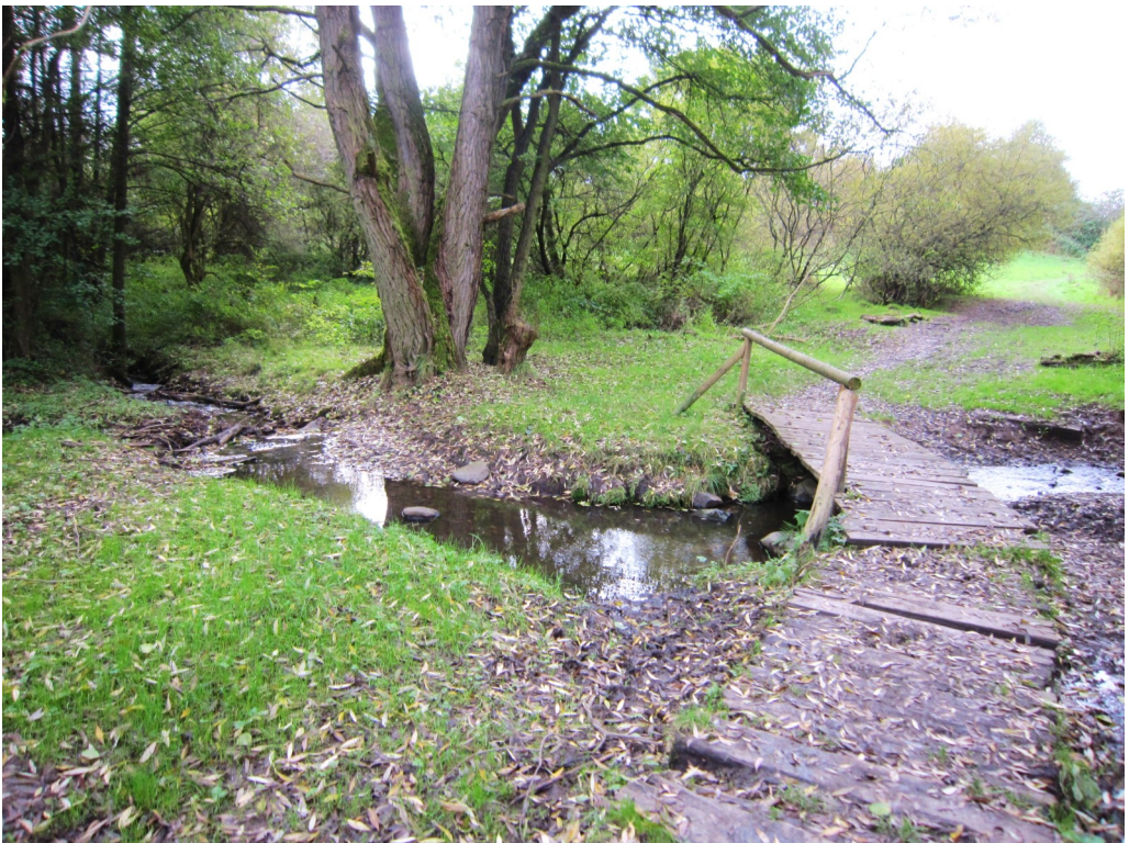
Der Dönchebach unterhalb der documenta-urbana-Siedlung

In den Sommermonaten der letzten Jahre bestand immer wieder die Gefahr, dass die Dönche als größtes innerstädtisches Natur-