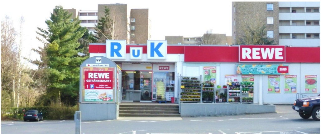
Der RuK-Rewe-Markt in der Leuschnerstraße

Neben der großen Freude über die Solidarität der Bürgerinnen und Bürger mit ihrem Geschäft berichtete Frau König auch über aktuelle Entwicklungen und ihre weiteren Pläne mit dem Rewe-Markt. So freut sie sich, dass die Flüchtlinge aus der Landes-