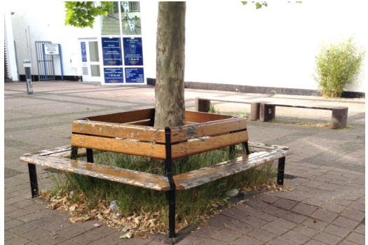
Bank um die Platane auf dem Rhönplatz

Habe ich Sie mit diesen Themen neugierig gemacht? Kommen Sie doch einmal zu einer der nächsten Sitzungen des Ortsbeirats und überzeugen Sie sich über die gute Arbeit, die